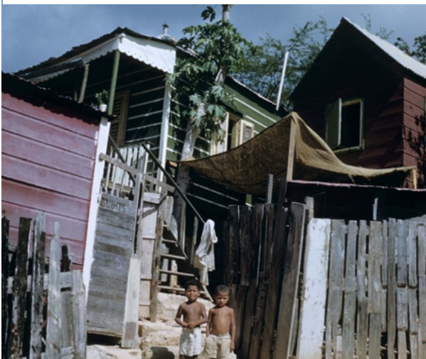
Figuur 7. Verschillende hoogtes.