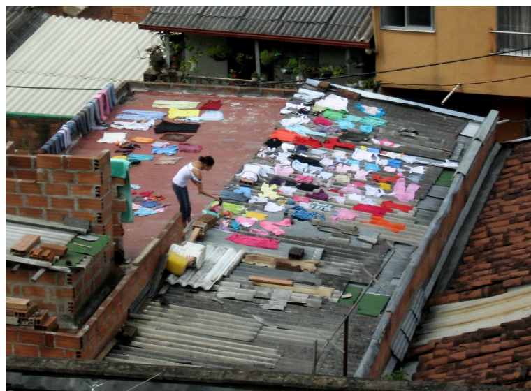
Figuur 9. Sacando la Ropita.