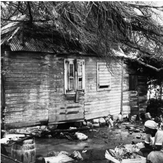
Figuur 2. Woning gefotografeerd in 1955. Houten woning met zinkplaten dak. Op de voorgrond vrouw met een kratje met groenten.

De bewoners van de reeds genoemde volkswijken, waaronder Fleur de Marie, vonden van oudsher werk in de werven, op de olieraffinaderij of in de grote herenhuizen in het chique Scharloo (als kok, tuinman, paardenverzorger, huishoudhulp of kinderverzorgster; 'yaya'). 13 De raffinaderij werkers werden 's ochtends op de hoek van de Handelskade en de Ruyterkade (Caprileskade) met een pont afgehaald en naar de Isla vervoerd. 14 Tegenover een van de oudste gebouwen op Scharloo (± 1750- het voormalige Hotel Venezuela en het huidige Maritiem Museum) op de hoek van de Annabaai en het Waaigat, lag de aanlegplaats