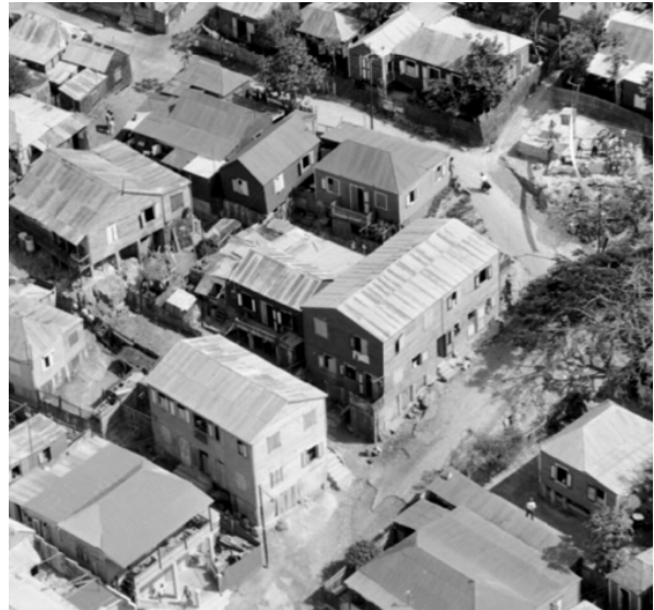
Figuur 6. Meer-verdiepingswoningen.