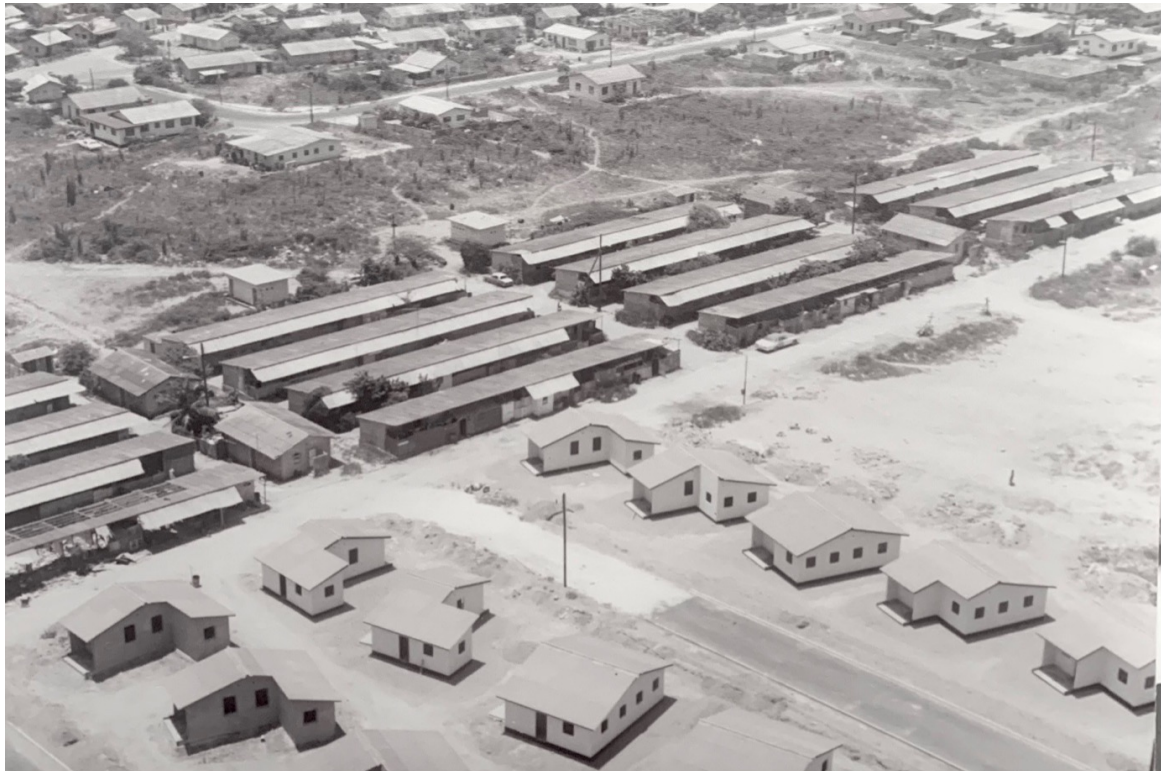
Figuur 3. De woningbouw weerspiegelde de hiërarchieën die heersten op de werkvloer, waarbij de arbeidersbarrakken en bungalows een groot contrast vormden ten opzichte van elkaar.

techniek om de solidariteit tussen de werkers te versplinteren; een essentieel middel om het risico op onrust en samenzwering te verkleinen in een maatschappij die lang bestuurd en werd door raciale vooroordelen en onderdrukking. Voor de Shell en de koloniale autoriteiten werd ras dus een gereedschap voor verdeling en pacificatie, waarbij de angst onder de elite heersers, voor de potentiële verontrustende impact van een bruisende industrie (denk aan vergrote sociale mobiliteit en verzwakking van de koloniale autoriteit), verzacht werd. 31