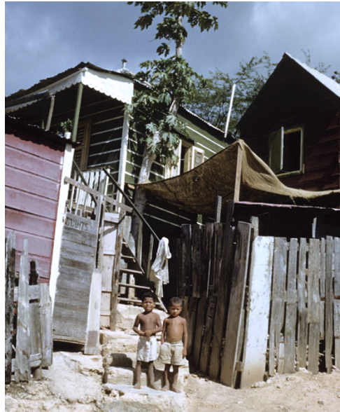
Figuur 4. Kinderen van Fleur de Marie.