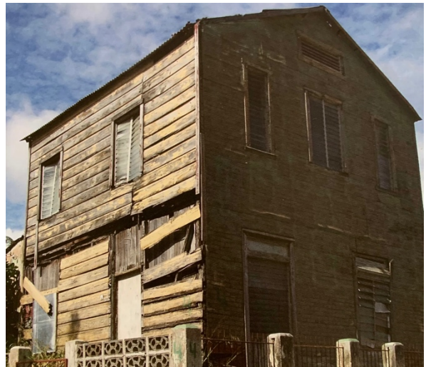
Figuur 8. Houten woning op Saliña.

Alhoewel Newton 84 en Gill 85 beweren dat houten woonhuizen met meerdere verdiepingen op Curaçao zeer uitzonderlijk zijn, levert het (beperkte) fotomateriaal bewijs dat meer-verdiepingswoningen op o.a. Fleur de Marie wel voorkwamen.