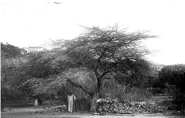
Figuur 1. Een indju-boom.

Fleur de Marie is vanaf haar ontstaan als woonwijk in gebruik geweest. Vondsten uit archeologisch onderzoek wijzen erop dat de bewoners voornamelijk uit de midden- en lagere klassen afkomstig waren. Hier woonden mogelijk ook tot slaaf gemaakten en/of vrije zwarten in de 19 e eeuw (Kuijlaars et al., 2012). Volksverhalen vertellen dat er slaven werden vastgebonden en gemarteld aan de Indju-bomen in de wijken die nu bekend zijn als Zwaan en St. Jago (Mylene, Balentin & Monsanto, 2019). Of dit ook gebeurde op Fleur de Marie is niet duidelijk, maar de Indjubomen mogen volgens deze volksverhalen niet omgekapt worden, omdat het volgens bijgeloof niet goed afliep met degenen die dit waagden.