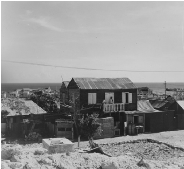
Figuur 5. Meer-verdiepingswoning

trekt hoge muren op rond de erfjes en blindeert de ramen of plaatst er gordijntjes om onbescheiden blikken buiten te houden, zodat contact met de burens alleen via de straat mogelijk is. 83